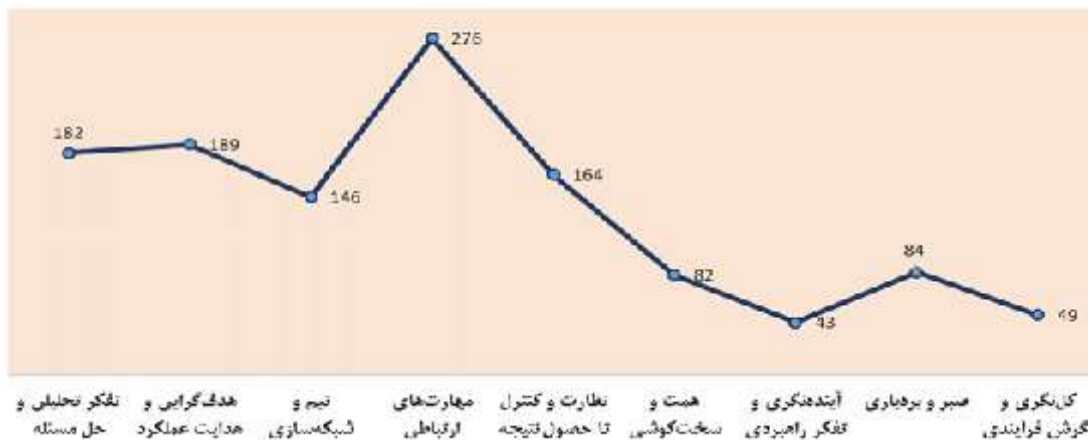
توزیع تعداد فراگیران به تفکیک انواع شایستگی

در مدل شایستگی‌های عمومی مدیران حرفه‌ای، وجود شایستگی «مهارت‌های ارتباطی» برای مدیران سطح میانی و عملیاتی به‌صورت الزامی و در بخش شایستگی‌های تکمیلی برای مدیران سطح پایه به‌صورت اختیاری تعریف شده است. برای توسعه این شایستگی ۵ عنوان دوره آموزشی تعریف شده است؛ که عبارت است از: فن نوشتن و بیان و گوش دادن فعال، زبان بدن و ارتباطات بین فردی، ارتباط خلاق و اثربخش، ارتباطات سازمانی و روان‌شناسی ارتباطات. این دوره‌ها در ۳۲ ساعت آموزشی برنامه‌ریزی و اجرا شده است.