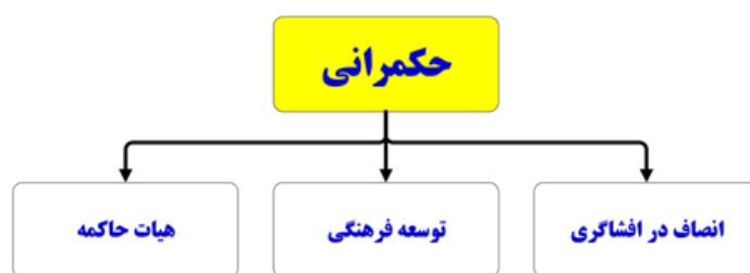
شکل ۲: حوزه‌های عملکردی حکمرانی (نواز و کوک، ۲۰۱۹)

اساس نظریه داده بنیاد از طریق بررسی متون و مصاحبه عمیق و نیمه ساختاریافته با ۱۲ نفر از خبرگان حوزه منابع انسانی در وزارت بهداشت و دانشگاه‌های علوم پزشکی با روش نمونه‌گیری گلوله برفی تا حد اشباع نظری جمع‌آوری و تحلیل گردیده است. نتایج پژوهش نشان داد که پاسخگویی، شفافیت، نگرش و هویت‌بخشی، هماهنگ‌سازی، نتیجه‌گرایی، اثربخشی نقش‌ها و وظایف در مسیر توسعه منابع انسانی مبتنی بر حکمرانی خوب منجر به توسعه فرهنگی- اجتماعی، توسعه فردی و توسعه آموزشی می‌گردد. زمانی و همکاران (۱۴۰۰) به بررسی اثر سرمایه انسانی بر حکمرانی خوب در استان‌های ایران پرداختند. در این مقاله با اشاره به استان‌های ایران و برای دوره ۱۳۸۵ تا ۱۳۹۵ و مبتنی بر ۵ گروه از شاخص‌های اصلی حکمرانی جهانی (پاسخگویی و حق اعتراض، اثربخشی دولت، کیفیت مقررات، حاکمیت قانون و کنترل فساد) اثر سرمایه انسانی بر حکمرانی خوب بررسی شده است. بعد از نرمال‌سازی داده‌ها، مدل از طریق رهیافت داده‌های تابلویی و با کمک نرم‌افزار استاتاستیک و روش ۲SLS برآورد شده است. با توجه به ضرایب رگرسیونی، نتایج نشان دهنده اثر مثبت و معنادار سرمایه انسانی بر حکمرانی خوب در استان‌های ایران است و افزایش یک درصد در نرخ قبولی دوره متوسطه باعث افزایش ۲۱ صدم درصدی در شاخص حکمرانی خوب می‌شود.