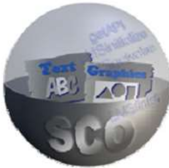
شکل ۳: نمایی Content Aggregation

در خصوص فراداده‌های کتابخانه‌ای برداشته شده است. بر اساس سند scorm ابر داده عبارت است از مکانیسمی برای توصیف اجزای یک مدل محتوا.