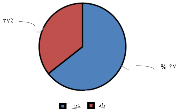
شکل ۴. برخورداری سازمان از رشد سازمانی با توجه به برنامه‌ریزی‌های مؤثر

و رشد سازمانی انجام داده است. تجزیه و تحلیل کای دو، ارتباط معنی‌داری را بین متغیر مستقل و وابسته نشان داد (جدول ۳). مقدار احتمال ۳ آزمون کای دو کمتر از ۰.۰۵ است. ما فرضیه صفر عدم ارتباط بین برنامه‌ریزی جانشین‌پروری و رشد سازمانی را رد کردیم.