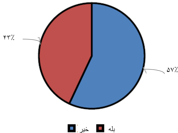
شکل ۲. سازمان برنامه مدونی دارد/ برنامه جانشین‌پروری برای رسیدن به رشد سازمانی

۷۳ درصد پاسخ‌دهندگان موافق بودند که سازمان آن‌ها در سه سال گذشته رشد داشته است (شکل ۳). آنها توافق کرده‌اند که اندازه سازمان از نظر تعداد کارکنان شاغل افزایش یافته است. آن‌ها توافق کردند که سازمان در سه سال گذشته، کارکنان مناسبی را برای موقعیت مناسب استخدام کرده است. سازمان همچنین کارکنان موجود را با رفتار منصفانه با آن‌ها حفظ می‌کند. ظفر، ممون و خان ۱ (۲۰۱۸) می‌گویند سازمان مورد بحث می‌تواند با درگیر کردن برنامه توسعه سازمان که شامل آموزش کارمندان برای مأموریت‌های آینده شرکت است، توانایی کارمندان را افزایش دهد. مطالعات نشان داده است که در سازمان‌هایی که سیاست استخدامی بهتری وجود دارد، همیشه جابجایی کارکنان کمتر است.